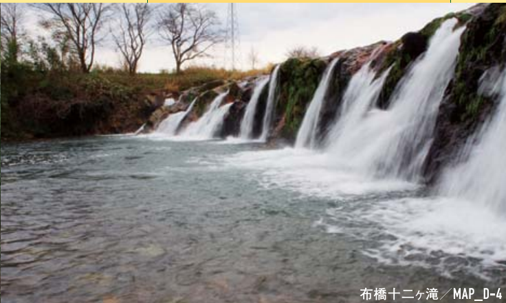
布橋十二ヶ滝 / MAP_D-4