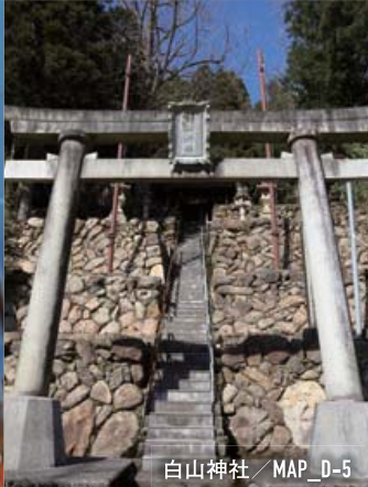
白山神社 / MAP_D-5