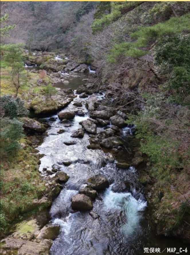
荒俣峽 / MAP_C-6