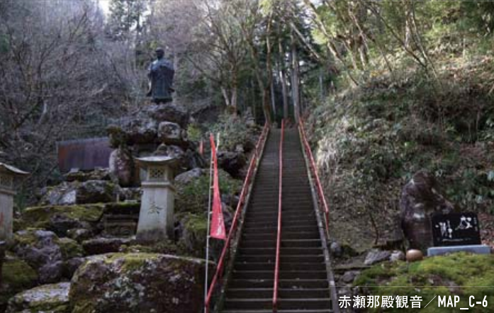
赤瀬那殿観音 / MAP_C-6