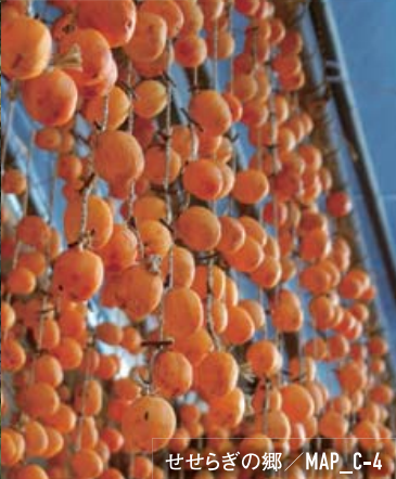
せせらぎの郷 / MAP_C-4