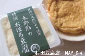
村田豆腐店 / MAP_C-4