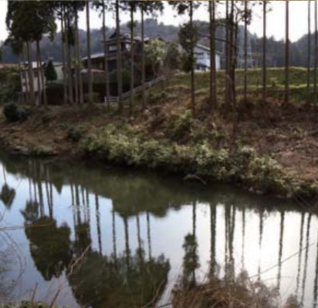
観音下石切り場 / MAP_D-4