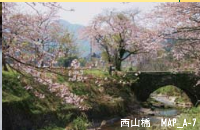
西山橋 / MAP_A-7